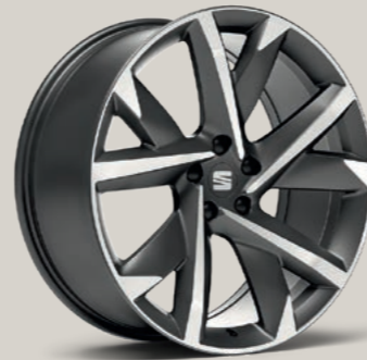
20"-LEICHTMETALLRAD SUPREME II GLANZGEDREHT FR

Style St XPERIENCE XP FR FR Serie ■ Optional ■