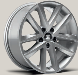
17"-LEICHTMETALLRAD DYNAMIC St