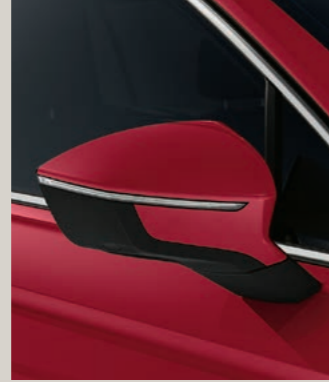
MERLOT ROT METALLIC St XP FR