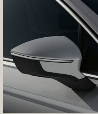
REFLEX SILBER METALLIC St XP