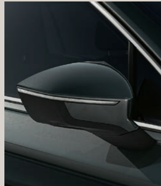
DARK CAMOUFLAGE METALLIC St XP FR