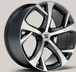
19"-LEICHTMETALLRAD EXCLUSIVE II GLANZGEDREHT FR