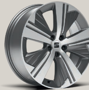
19"-LEICHTMETALLRAD EXCLUSIVE AERO GLANZGEDREHT XP