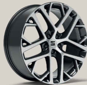
20"-LEICHTMETALLRAD SUPREME III GLANZGEDREHT XP