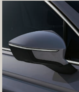
DELPHIN GRAU METALLIC St XP FR