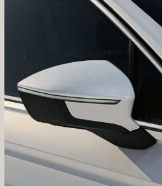
ORYX WEISS METALLIC St XP FR

Style St XPERIENCE XP FR FR Serie ■ Optional ■