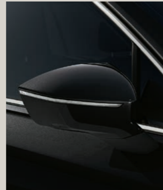
DEEP SCHWARZ METALLIC St XP FR