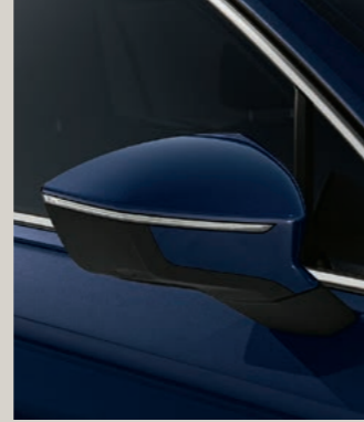
ATLANTIC BLAU METALLIC St XP