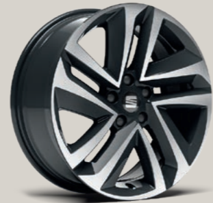
18"-LEICHTMETALLRAD PERFORMANCE GLANZGEDREHT St