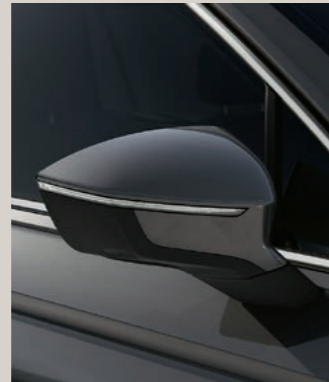
URANO GRAU St XP FR