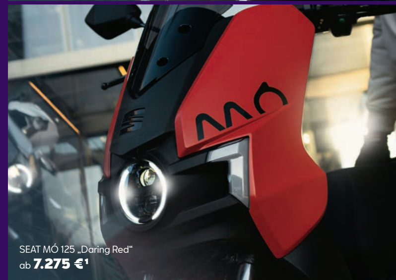
SEAT MÓ 125 „Daring Red“ ab 7.275 € 1