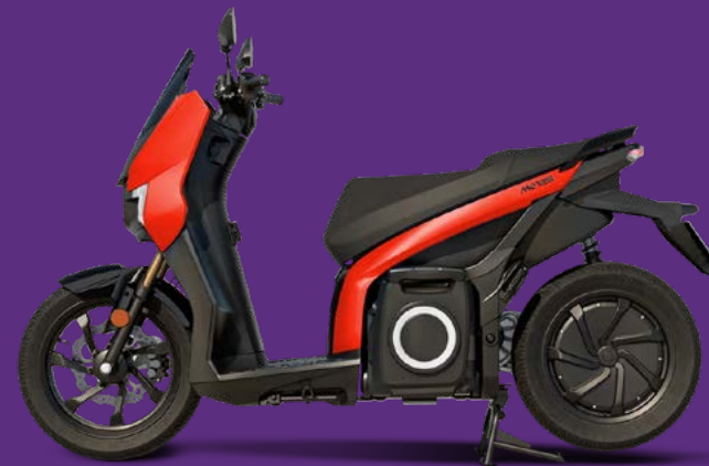
SEAT MÓ 125 Performance „Pamplona Red“*