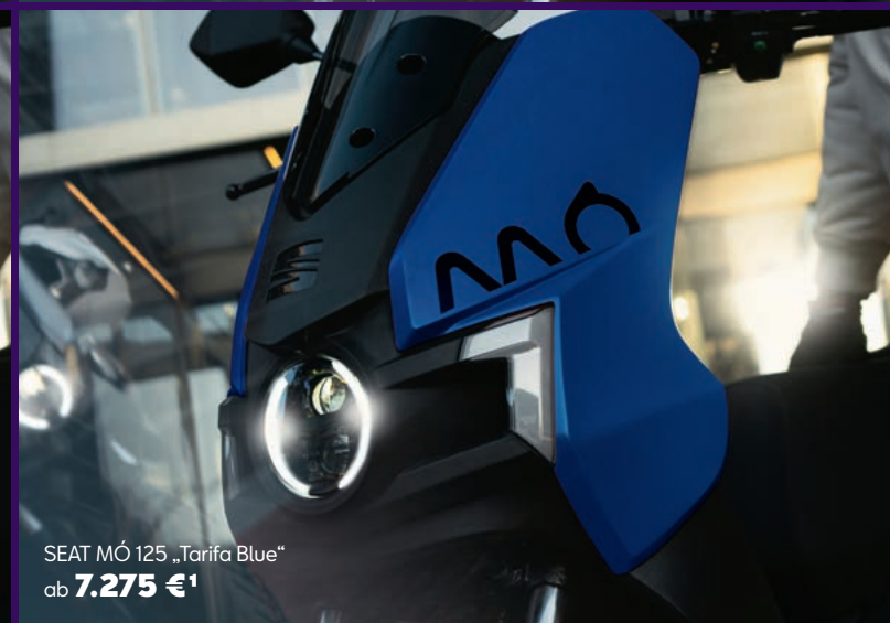
SEAT MÓ 125 „Tarifa Blue“ ab 7.275 € 1