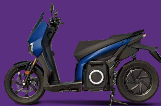
SEAT MÓ 125 Performance „Tarifa Blue“