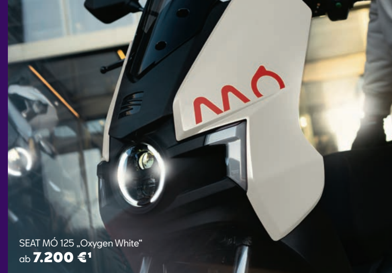
SEAT MÓ 125 „Oxygen White“ ab 7.200 € 1

Mit welcher Farbe möchtest du deine Stadt aufmischen?