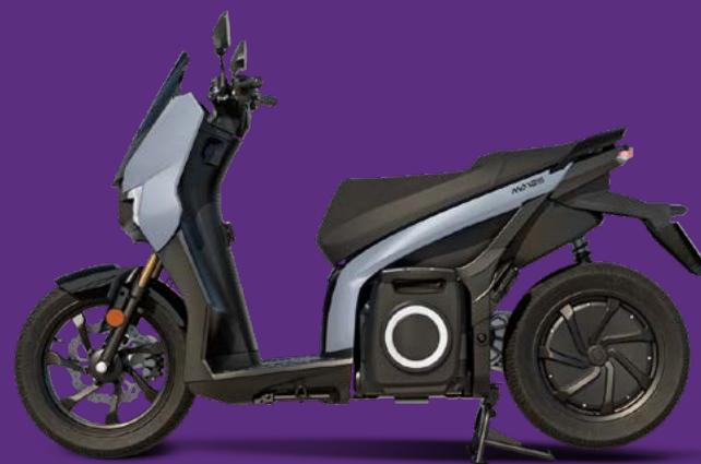
SEAT MÓ 125 Performance „Barcelona Grey“