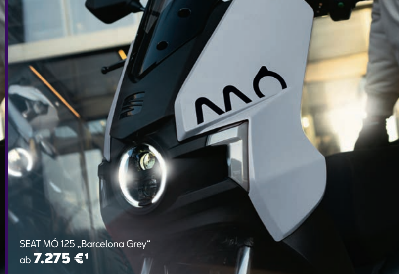
SEAT MÓ 125 „Barcelona Grey“ ab 7.275 € 1