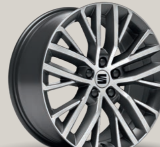
PERFORMANCE I XC IN ATOM GRAU, GLANZGEDREHT 1