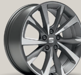
PERFORMANCE I IN COSMO GRAU, GLANZGEDREHT 1