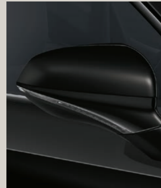
MIDNIGHT SCHWARZ 2