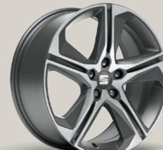
PERFORMANCE II IN COSMO GRAU, GLANZGEDREHT 1