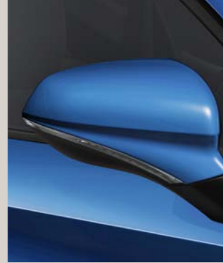
SAPHIR BLAU 2