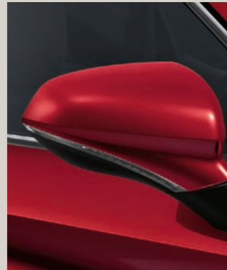
DESIRE ROT 3