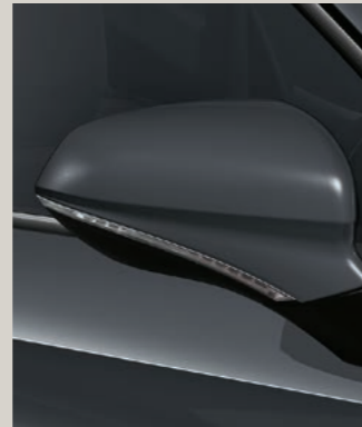
GRAPHENE GRAU 3