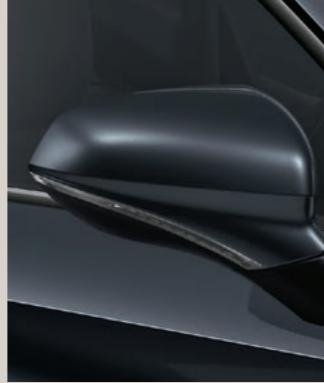
MAGNETIC GRAU 2