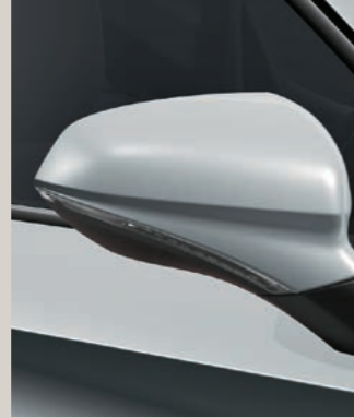
NEVADA WEISS 2